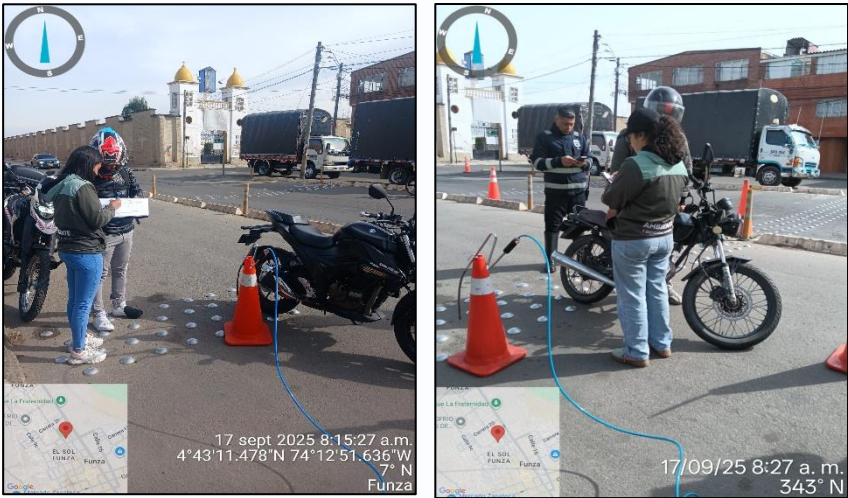
Ilustración No. 1. Operativo pedagógico fuentes móviles.