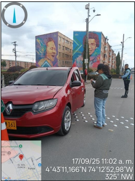
Ilustración No. 3. Operativo pedagógico fuentes móviles.