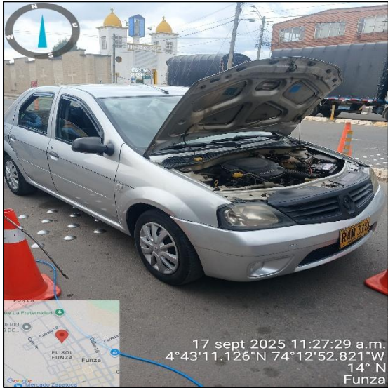
Ilustración No. 4. Operativo pedagógico fuentes móviles.